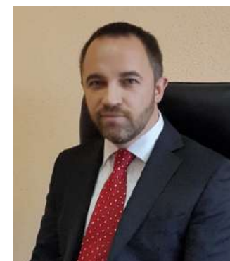
Director General de GRUPO EUROFESA

GRUPO EUROFESA es una empresa que trabaja a nivel nacional con unos valores de compromiso hacia nuestros más de 20.000 clientes referenciados, proveedores y trabajadores, conscientes de nuestra responsabilidad social que nos sitúa como una compañía de presente y futuro.